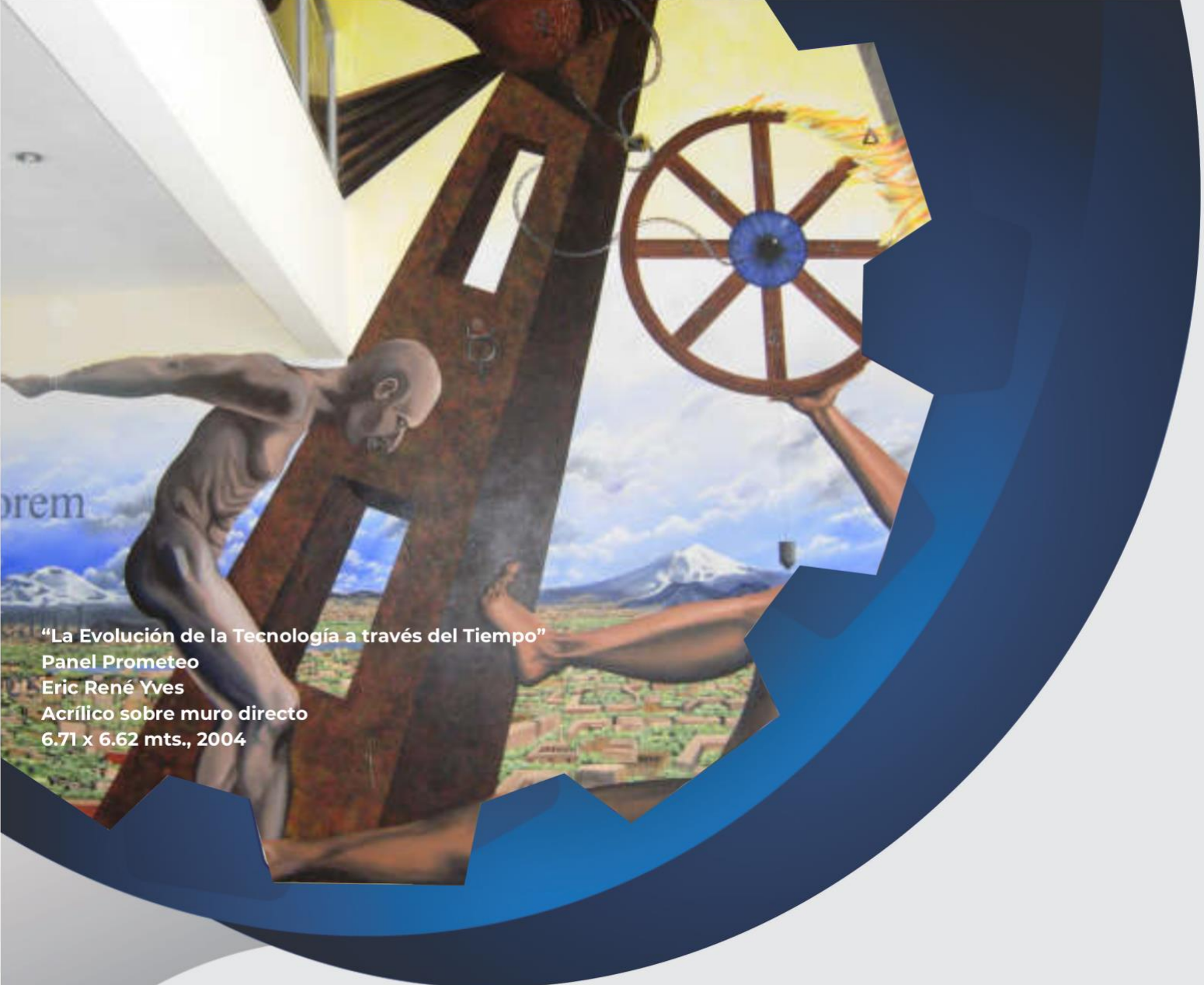
“La Evolución de la Tecnología a través del Tiempo” Panel Prometeo Eric René Yves Acrílico sobre muro directo 6.71 x 6.62 mts., 2004