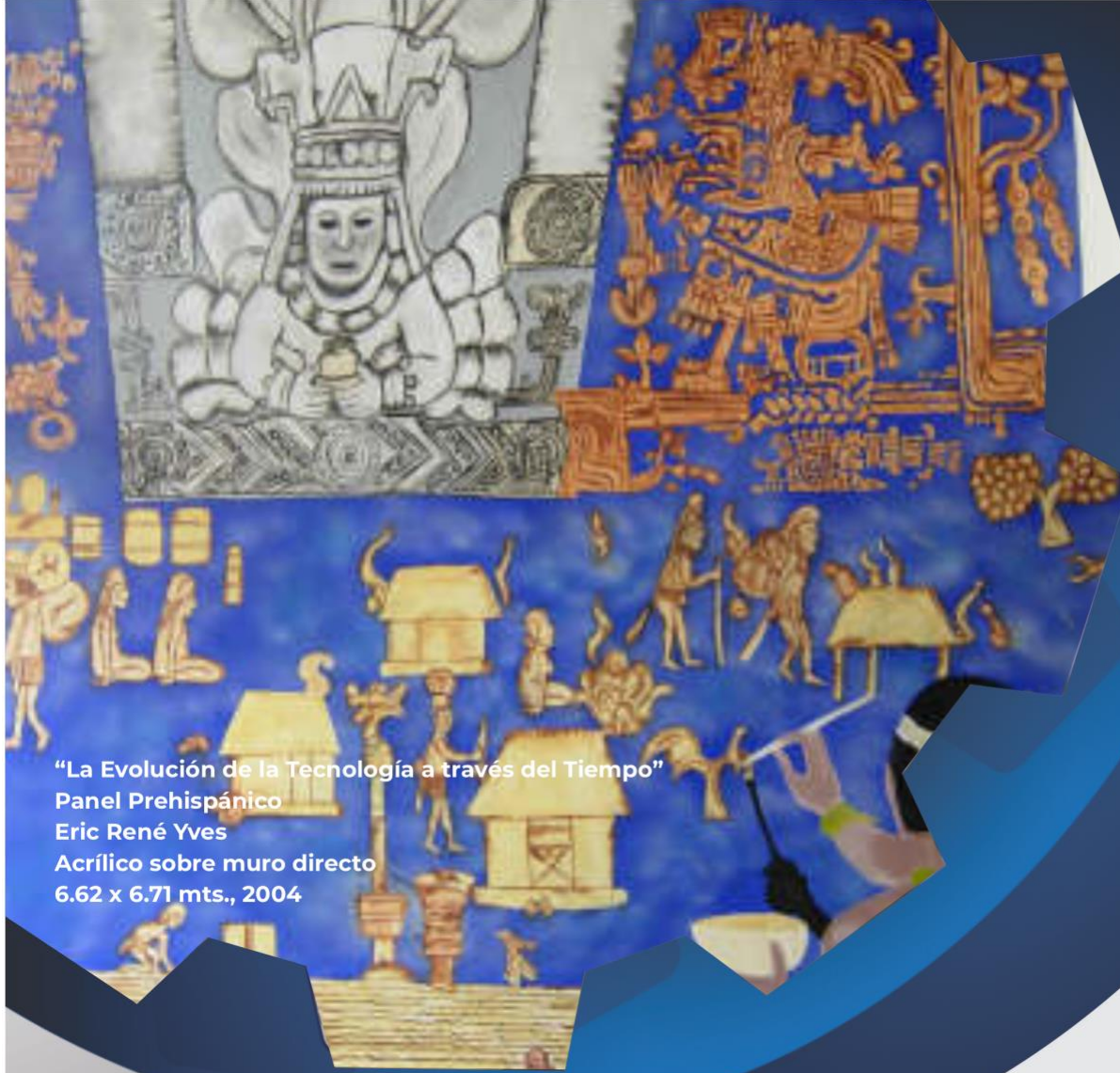
“La Evolución de la Tecnología a través del Tiempo” Panel Prehispánico Eric René Yves Acrílico sobre muro directo 6.62 x 6.71 mts., 2004