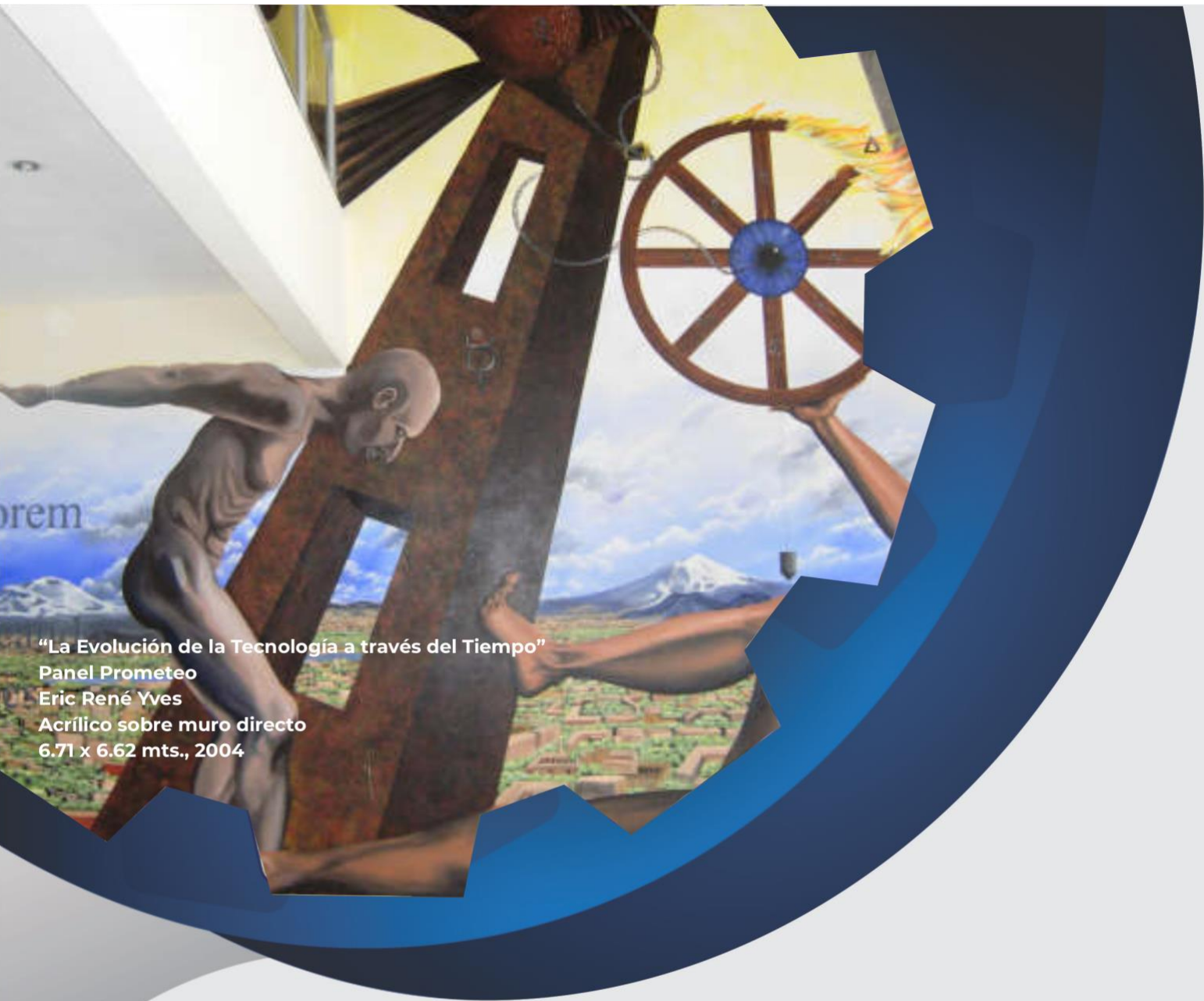
“La Evolución de la Tecnología a través del Tiempo” Panel Prometeo Eric René Yves Acrílico sobre muro directo 6.71 x 6.62 mts., 2004